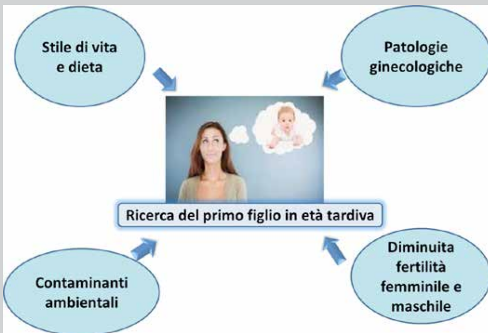
Figura 3: Determinanti della denatalità.

Dall'analisi dei determinanti della denatalità emerge quindi il ruolo dell'età avanzata ma anche ad altri fattori quali lo stile di vita, la dieta alimentare, i contaminanti ambientali e le patologie ginecologiche ( Figura 3 ).